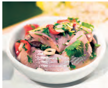
Silllunchen är en uppskattad tradition.

Det gör du till Solveig på telefon 073-755 04 63 på måndagar och onsdagar mellan kl. 10.00–12.00