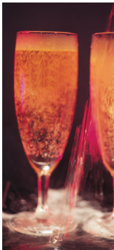
Välkommen till Allhuset den 2 oktober. Då håller avdelning 115 höstmöte och vi firar 10-års jubileum.

Ni ska inte vara hemma Utan kom och njut ett tag Av god mat och trubadur Med din lott du kan ha tur.